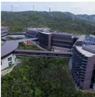
センター棟と3つの研究棟を連結するスカイウォーク